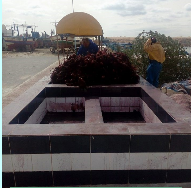
أحواض صباغة الشباك