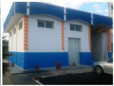
تهيئة سوق الجملة للأسماك