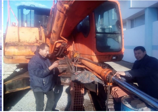
صيانة آلة الجهر