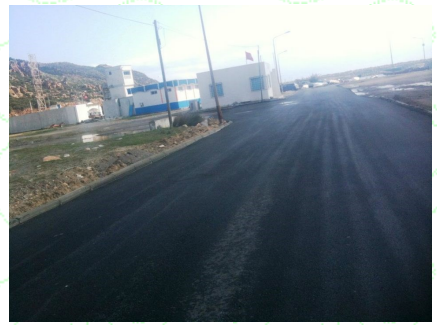
تعبيد الطريق وزراعة شجرة زيتون بالمفتق الدائري وسط الميناء

وفي نفس السياق ودعمًا لمجهودات وكالة موانئ وتجهيزات الصيد البحري وجمعية النادي الأزرق التقليدي، قامت مصالح معتمدة الهوارية بأشغال تبيط الطرقات بالميناء. وقام السيد فوزي بن حميدة رئيس مدير عام وكالة موانئ وتجهيزات الصيد البحري بتاريخ 2 مارس 2018 بزيارة ميدانية لميناء الصيد البحري بالهوارية للإطلاع على أشغال تهيئة سوق الجملة للأسماك وتبيط الطرقات كما قام بالإستماع لمشاغل البحارة والمشاكل التي تعيق نشاطهم.