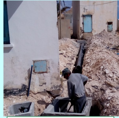
إنجاز شبكة لتصريف مياه الأمطار