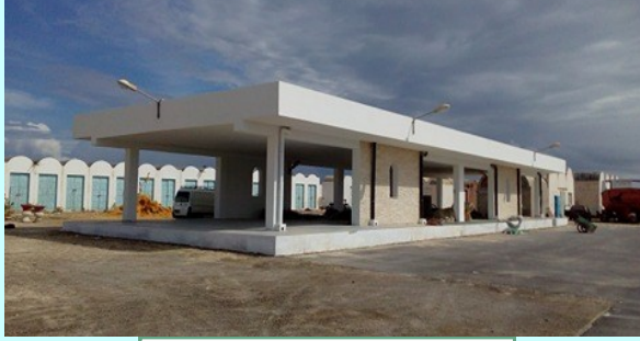
بناء فضاء ترقيع الشباك