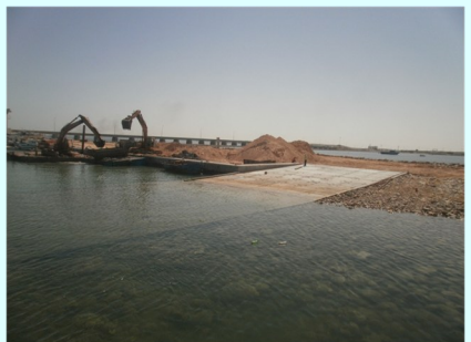
تركيز مجبد سفن جديد