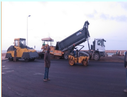
تبليط الأرضيات وتعبيد الطرقات