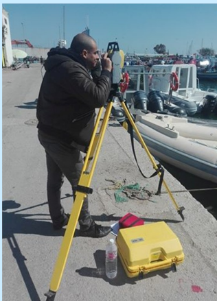
محطة قياس شاملة

وقد تم إلى حدود شهر مارس 2017 رقمنة البيانات والمعطيات الجغرافية الخاصة بجوالي 20 ميناء صيد بحري بما في ذلك مقاسم الملك العمومي المينائي وشبكات الطرق والماء والكهرباء والتطهير.