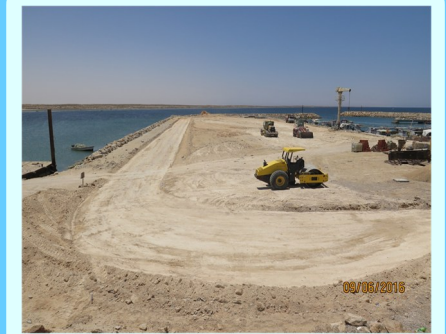
تهيئة أرضية جديدة