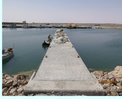
تركيز رصيفين عائمين جديدين