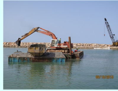
جهر حوض الميناء