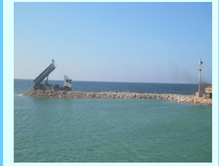
مد الحواجز الواقية