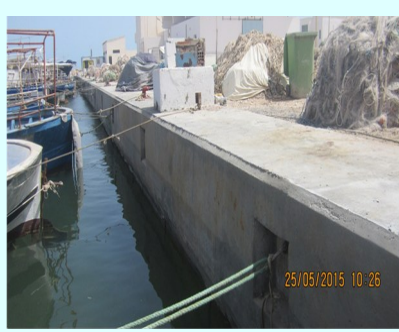
إصلاح وصيانة الرصيف القائم